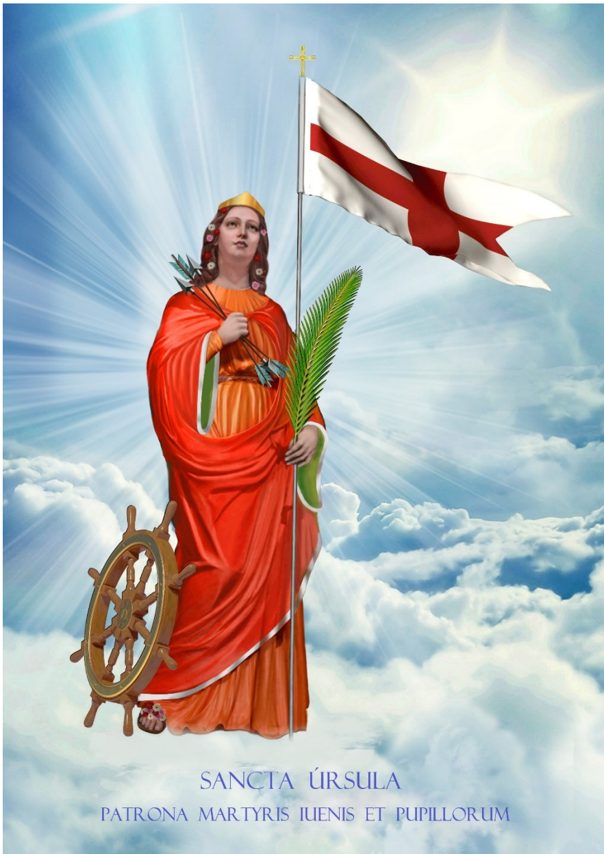
SANCTA ÚRSULA PATRONA MARTYRIS IUENIS ET PUPILLORUM